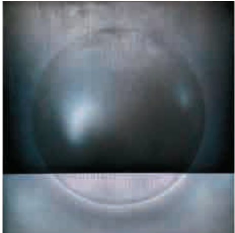
▲甫入展廳，首先映入眼簾的即是《浮提》(1976, 布本塑膠彩)