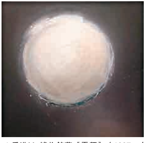
▲香港M+博物館藏《霧顏》(1987, 布本塑膠彩)