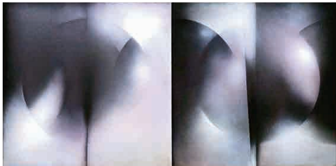
▲韓氏夫婦收藏《兩緣》(1977, 布本塑膠彩)