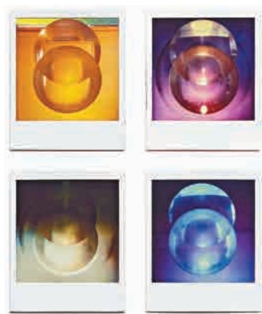
▲香港文化博物館藏《無題04、13、14、05》(1983, 寶麗來照片)

韓志勳所採用的媒介及技巧多樣，除了油彩、塑膠彩、絲印拼貼、噴筆及潑彩外，亦曾嘗試於畫面上配合石塊、鐵輪及書法等，效果卻又統一而融合。1980年代後，城市在變，他的「圓」也跟着轉動，1990年代開始，他的畫不拘於很多既有的元素，但同時又隱約見到很多理念的重現。步入展廳最