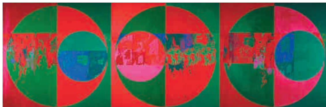
▲香港藝術館藏韓志勳代表作《火浴》(1968, 油彩、塑膠彩及絲印布本), 韓氏以多種技法展現上世紀60年代愈漸繁華的香港