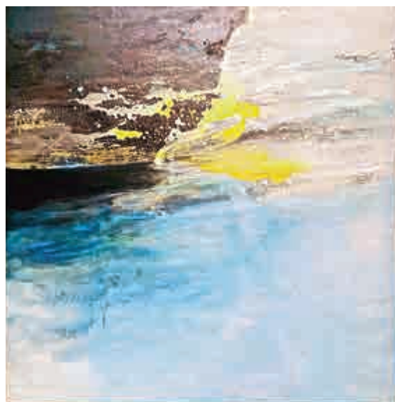
▲《沛餘》(2004, 布本塑膠彩) 英文題「To the Heavenly Brim」, 有典故、有隱喻