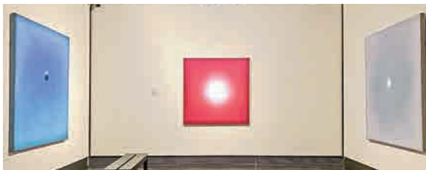
▲「意欲淵停」展廳，集中展示「圓」系列