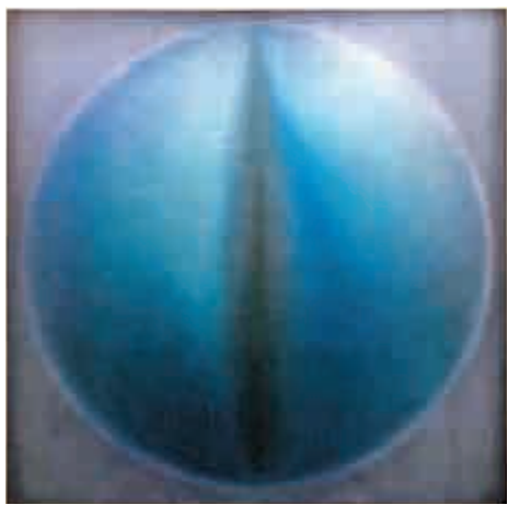
▲《恆淵》(1971, 布本塑膠) 以充滿情色暗示的手法描繪女體

韓氏在1969年成為香港首位獲得洛克菲勒三世基金會(現為亞洲文化協會)獎助金的藝術家。他的作品被香港藝術館、香港文化博物館、香港大學美術博物館、公司和私人等納為收藏。2013年獲香港特區政府頒發榮譽勳章，表揚其藝術成就；又於2017年獲亞洲協會香港中心頒發「亞洲藝術創變者大獎」。時至今日，其畫作仍令香港各公共空間生輝，如怡和大廈、香港會展中心和港鐵觀塘站。韓志勳於2019年2月24日辭世，享年96歲。