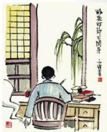
豐子愷《好花時節不開身》

話說，1921年豐子愷短暫留日學習西洋畫，偶然在舊書攤讀到竹久夢二的畫集《春之卷》，被書中《同級生》等畫作打動。豐子愷將《春之卷》的影響帶回國，結合李叔同、陳師曾和他的藝術閱歷，繼續創作。1924年在《我們的七月》雜誌上發表《人散後，一鉤新月天如水》，獲得好評，此畫至今更是豐氏的代表作。在《人散後，一鉤新月天如水》、《考試》等作品明顯見到竹久夢二對豐氏的啟迪。