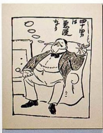
竹久夢二的《四十男》