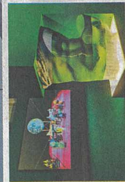
■楊嘉輝的雙頻道錄像裝置《The World Falls apart into Facts》有點餓時就不要吃了。