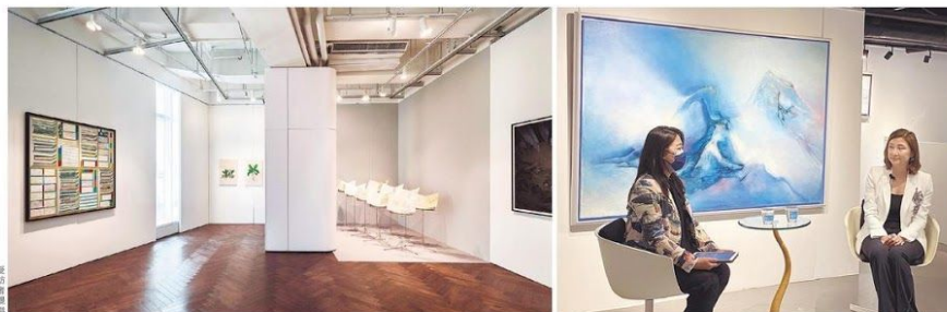
疫情下，藝廊更顯蕭條，本地畫廊「方由美術」坦言上月試過整個星期的參觀人數近乎零。