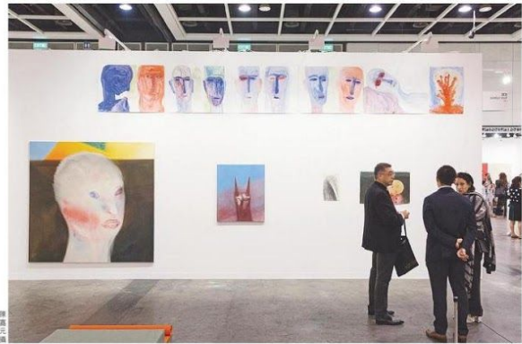
網上展覽無法取代實體展覽面對面交流的機會，但有助藝廊在艱難時期與藏家保持關係。