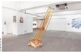
裝置藝術講求現場實感，網上展覽難以充分呈現，故較難引起網上買家的興趣。

去年美國藝術家兼設計師KAWS的維多利亞港大型漂流公仔成為全城打卡熱話，然而，因為新冠病毒的蔓延，今年他構思與英國Acute Art合作，透過虛擬以及擴增實境科技，讓藝術愛好者藉着購買下載手機應用程