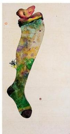
周綠雲作品《無題（螳螂附絲襪）》，1980年。宣紙本水墨設色及混合媒體。該作品從未展出，是次展覽為首次。

日期：即日起至2020年1月5日 時間：星期二至日上午11時至下午6時 每月最後一個星期四上午11時至晚上8時 地點：金鐘正義道9號亞洲協會香港中心 麥禮賢夫人藝術館