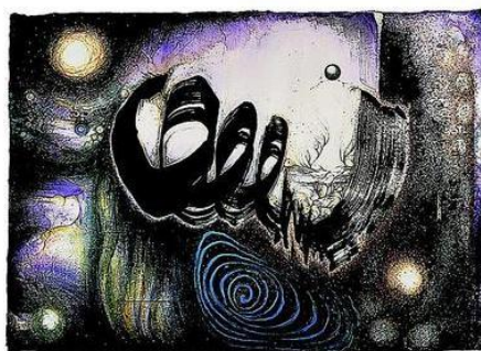
周綠雲作品《紫色宇宙》，1996年。

女性向來代表溫柔、知性，在不少女藝術家的作品中亦能讓人體會這些特質。周綠雲作為新水墨運動的先驅，作品用色大膽，抽象的構圖下卻充滿柔和感，讓讀者有種放鬆的感覺。現正舉辦的展覽「萬象之根：周綠雲繪畫藝術展」，會帶領觀者探索這位女藝術家作品中蘊藏對於生活和生命的看法，關注藝術與精神健康的關係。