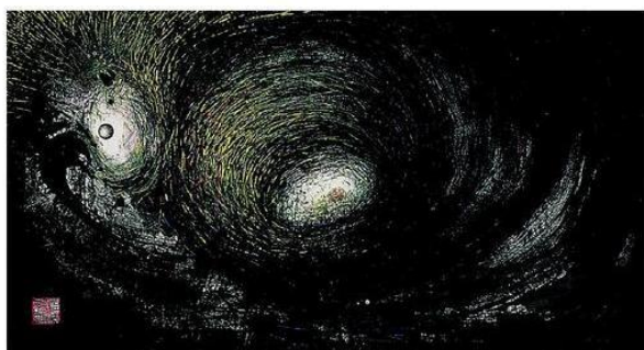
周綠雲作品《漩渦》，1991年。