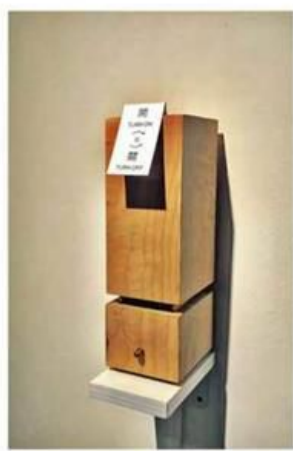
《Ripening of Mangosteen: A Scent Offering in Fragments》。噴霧器目的是探討氣候變化和自然災難帶來的無形影響。