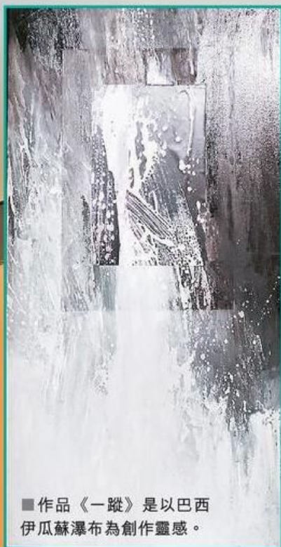
■ 作品《一蹤》是以巴西伊瓜蘇瀑布為創作靈感。