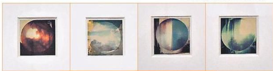
■ 韓志勳的寶麗來攝影作品。