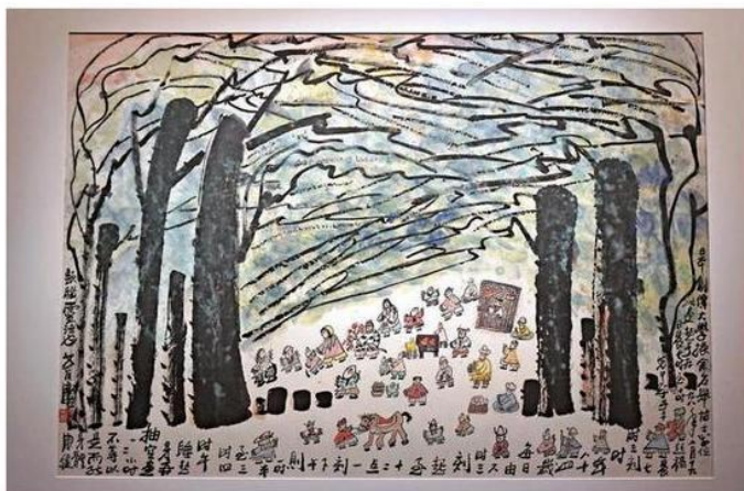
▲《樹下逸樂園》以狂草線條入畫，人物稚拙，充滿童趣

亞洲協會香港中心位於金鐘正義道9號，逢周一休館。查詢展覽詳情可電二一〇三九五一一，或瀏覽網頁www.asiasociety.org.hk。