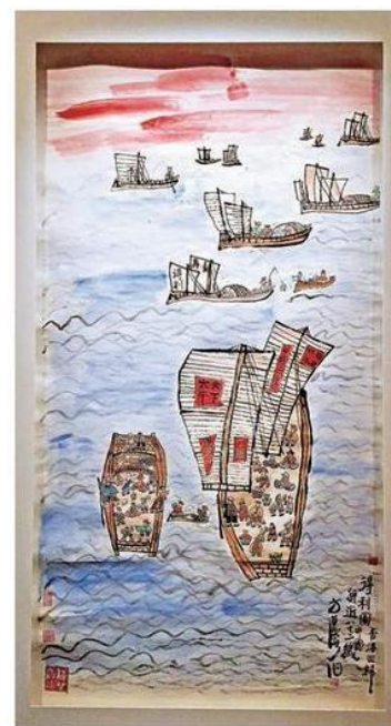
▲《得利圖》象徵香港民衆重回祖國懷抱