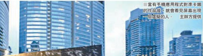
■ 當有手機應用程式對準卡娜的作品後，就會看見屏幕出現一個虛擬的人。