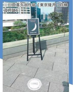
川田喜久治作品《東京殘月、白楊及月跡》

現自己的感受。「為何要用科技作為藝術創作的媒介，是因為科技是我們不能避免的東西，也是一個可以表達前瞻性概念的媒介，有着無限可能性。」她說。