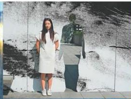
■ 卡娜的作品中有一個人形入口。