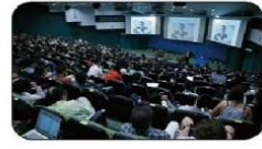
▲Niall Ferguson過去一周先後於科大及亞洲協會香港中心，剖析古今中外不同發展。