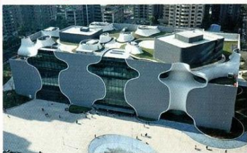
台中國家歌劇院外形獨特，充滿美感。

被譽為世界九大新地標建築之一的台中國家歌劇院(National Taichung Theater)，計畫今秋開幕。這個外形獨特的歌劇院，正是由鼎鼎大名的日本國寶級建築師伊東豐雄操刀設計，以世界首創「美聲涵洞」(Sound Cave)概念，獨步天下。設計背後，他自有理念：「我想做一個跟人的身體相似的建築！」