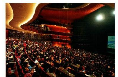
伊東豐雄笑言，歌劇院設計好像地底建築。

我們都是看《天空之城》長大的，未來建築，會跟天比高，還是相反地開發地底？伊東先生笑了起來，「我常常都有這些幻想。台中國家歌劇院那既懷舊又創新的「洞穴」設計，不也像地底建築嗎？」上月熊本發生地震，他感歎日本地震頻仍，或許有朝一天，日本變得不再適合居住，「人類對這些自然災害，還沒認識得夠深，以為靠黑科技就可以解決問題，甚至以為人可以勝天，其實大自然是很強大的，人類必須有這種自覺。」此話出自一位建築家的口中，太有說服力了。