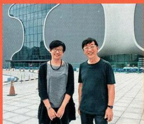
與歌劇院藝術總監王文儀(左)留影。