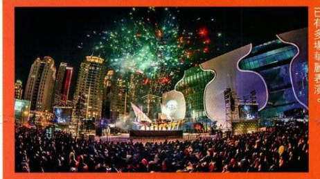
還未正式開幕，台中國家歌劇院外已有多場華麗表演。