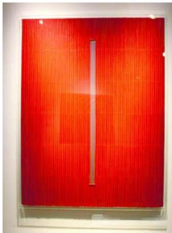
朴栖甫 《描法 NO. 130831》