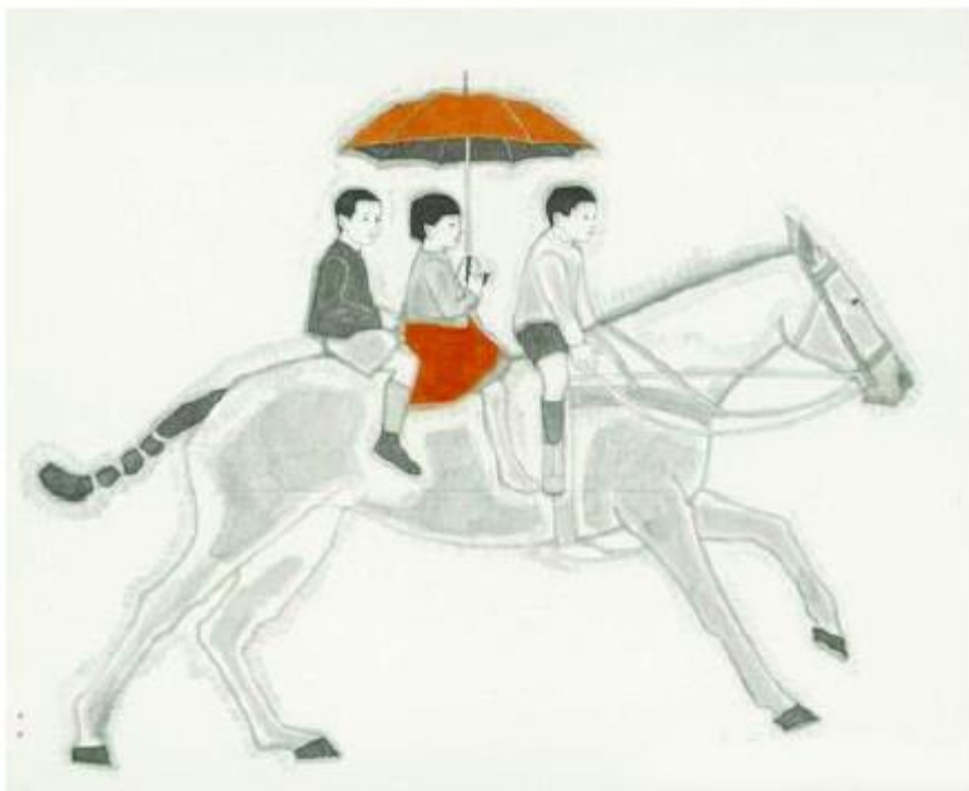
黄丹 《走马》 纸本水墨