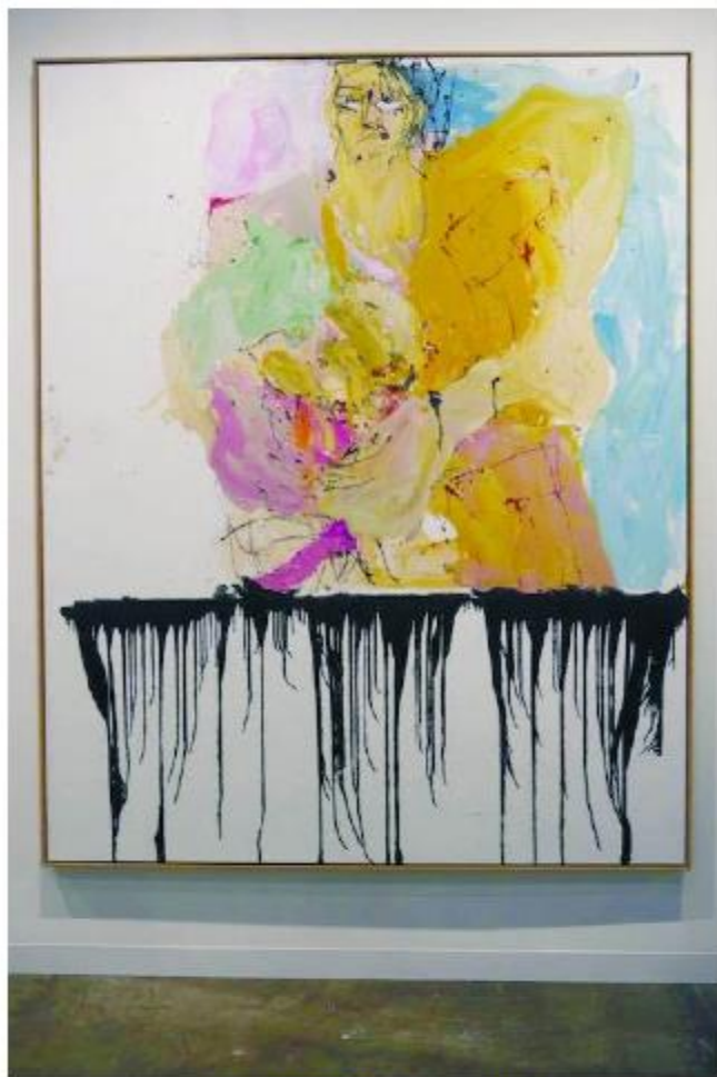
中国藏家购得的Baselitz作品

来源：中山日报 2016-03-26 第 7740 期 A7版 发布日期：2016年3月26日