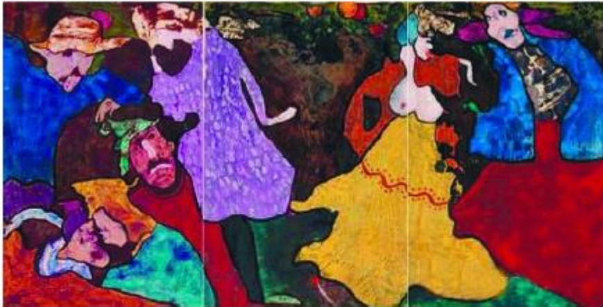
陈福普《争议》 丙烯纸本 1986年作

亚洲范围内最具规模的艺博会香港巴塞尔艺术展(Art Basel in Hong Kong)于3月22日和23日举办贵宾预展, 3月24日至3月26日对公众开放。2016年的香港展会有来自35个不同国家及地区的239家画廊参展, 被誉为“香港巴塞尔史上阵容最强大的一届”。