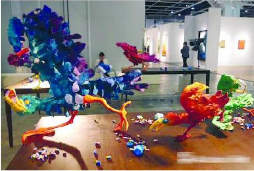
参加艺聚空间的作品, Nathalie Djurberg& Hans Berg 的 2015 年的作品 《A Thief Caught in the Act (Blue with Orange Legs)》以6万欧元价格由北欧藏家购得。