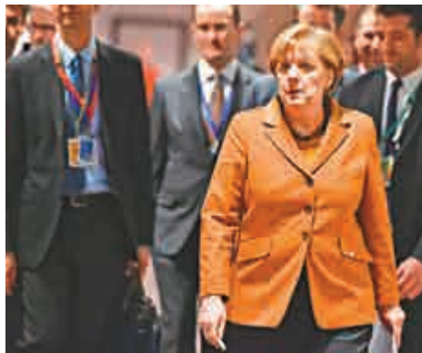
▲德國總理默克爾7日在布魯塞爾召開記者會