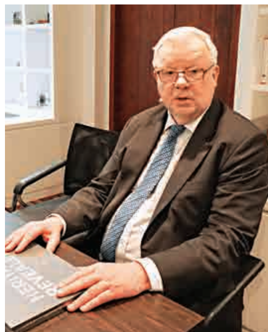
▶福克斯8日在香港亞洲協會接受本報專訪

福克斯表示，調低增幅正顯示了中國「不再是一個年輕的孩子了」，正在向一個更成熟經濟體進行轉型。他指出，中國作為全球第二大經濟體，就算GDP調低到6.5%至7.0%，這一增幅總額也幾乎相當於瑞典整個國家的GDP總值，所以他對中國經濟前景並不十分擔憂。福克斯認為，中國經濟不可能持續維