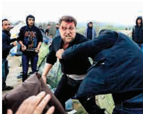
▲難民7日在希臘邊境發生衝突

德國三個州份即將舉行議會選舉，歷史尚短的德國選項黨（AfD），因為高調反對默克爾難民政策而成為最大獲益者。福克斯指，AfD對執政黨造成一些挑戰，有民衆不滿現狀，但他相信所謂的「右翼運動」最終都會消散。