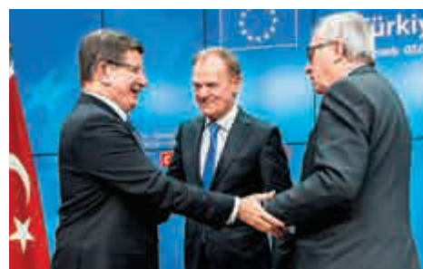
▲(從左至右)土耳其總理達武特奧盧、歐盟委員會主席容克和歐洲議會主席圖斯克8日舉行記者會

土耳其總理達武特奧盧在峰會上突然拋出新方案，表示土耳其將以「以人換人」的方案，重新接收經非法途徑由土耳其進入希臘的難民；即土耳其每接受一名被遣返的非法移民，歐盟就必須安置一名土