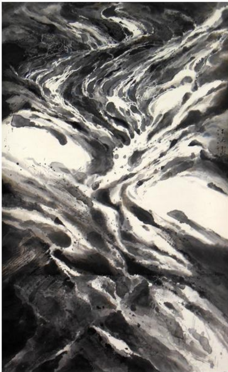
《大江二十》，王無邪，2012，水墨紙本，藝術家藏品，圖片由藝術家提供

在西方醉心發展油畫的檔兒，地球的另一端則以另一種媒介——水墨，表達他們對世界的想法。