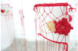
墨爾本皇家理工大學藝術碩士課程畢業展