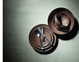
時尚瓷器餐具！Bottega Veneta全新系列登場