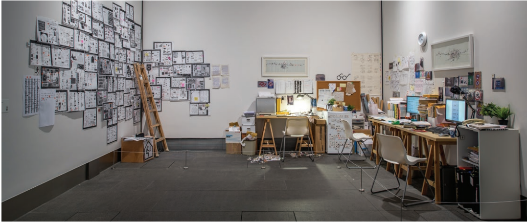
《地書》，2014。混合媒材，尺寸不定。

🎨 畫一畫 請畫出兩至三個您喜歡的普通符號或圖標。它們代表什麼？ 為什麼您會喜歡它們？